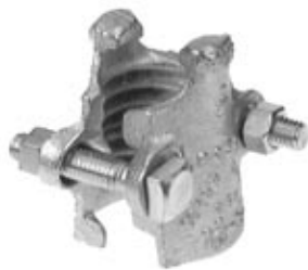
«BOSS» Зажимные Хомуты – с 2-мя болтами

Болты, используемые во взаимозаменяющихся зажимах Boss являются нестандартными. Они отличаются от стандартных длиной, диаметром, длиной резьбы, материалом и твердостью материала. Болты можно подтягивать несколько раз, но их нельзя несколько раз использовать. Они предназначены только для одноразового использования. Dixon рекомендует пользоваться только оригинальными затяжными болтами. Пользование болтами не компании Dixon может привести к серьезным нежелательным последствиям.